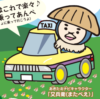
あきた北ナビキャラクター「又兵衛(またべえ)」

北秋田の旅はこれで楽々♪ みんなして乗ってあんべ (みんなが一緒に乗って行こうよ)